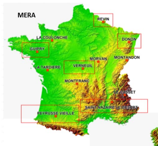
Figure 2 : Localisation des stations du réseau MERA

Les flux de dépôts atmosphériques moyens de fond en zone rurale ont été calculés à partir des 203 données mensuelles capitalisées entre 2016 et 2021. Pour le cadmium, le flux de dépôts atmosphériques moyen est de 0,23 \mu\text{g}/\text{m}^2/\text{j} en zone rurale .