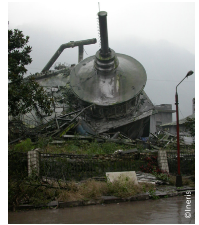
Figure 2 / Bâtiment industriel effondré suite au séisme du 12 mai 2008 dans la région du Sichuan (Chine)