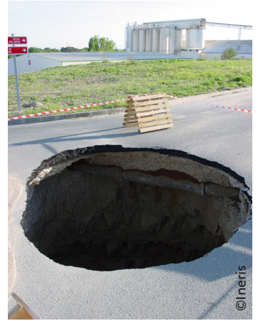
Figure 2/ Fontis débouchant sur une route

Il n'existe pas d'accident répertorié à ce jour dans la base ARIA du BARPI mais le risque pour le transport de marchandises dangereuses (TMD) ou les tuyauteries d'usine ou canalisations à risque enterrées existe.