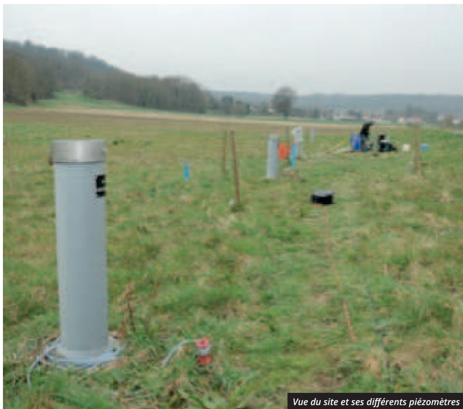
Vue du site et ses différents piézomètres

Cette semaine, le site est à nouveau mis à contribution dans le cadre du projet européen de recherche FP7 CO2QUEST (voir encadré ci-contre). Une nouvelle expérience de type push-pull est menée, avec une eau saturée en CO2 et à laquelle sont ajoutés un traceur et certaines substances annexes (parmi celles existant dans le CO2 industriel mais en très faible quantité et sans impact sur l'aquifère).